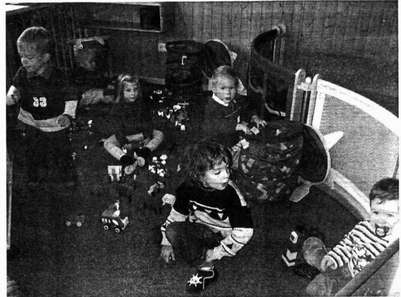
Im Freispiel, der selbstgesteuerten und individuellen Beschäftigung der Kinder, finden Begegnungen sowohl mit den Kindergartenkindern als auch mit den Hortkindern statt.