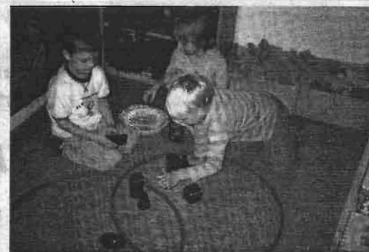
Was kann rollen? Was kann kippen? Welche geometrischen Körper können rollen und kippen? - Mengen und Schnittmengen.