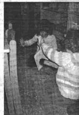
„Oh je, wie konnte das passieren? Gut, dass wir Schaufel und Besen haben!“