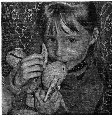
„Übergangsobjekte“ von Zuhause z.Bsp. Ein Kuscheltier