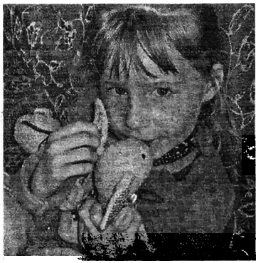
„Übergangsobjekte“ von Zuhause z.Bsp. Ein Kuscheltier

Für Kinder und Eltern sind diese Übergänge oft mit gemischten Gefühlen verbunden: Interesse und Neugier, Freude und Spaß, Stolz, Unsicherheit und Angst, Traurigkeit, Besorgnis und auch Trennungsschmerz. Wer kennt sie nicht, diese Emotionen, die uns auf neuen Wegen begleiten ?