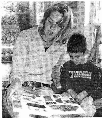
Angebote der Erzieherin als neue Bezugsperson fördern das Vertrauen

„Neu starten“ ist immer eine Herausforderung, die wir nur gemeinsam mit allen Beteiligten bewältigen können.