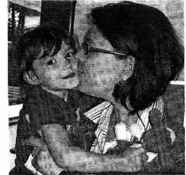
Positive Gefühle der Eltern spenden Kraft