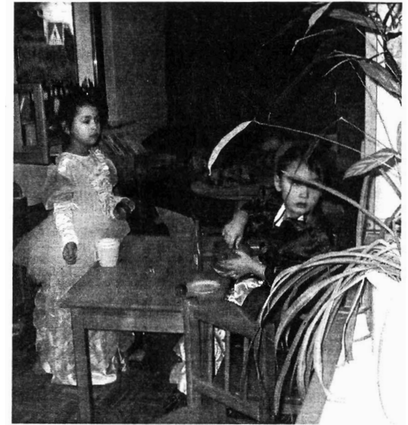
„Ich koche giftiges Essen für Schneewittchen. Schneewittchen ist tot gegangen, Dann hat der König mich geküsst.“