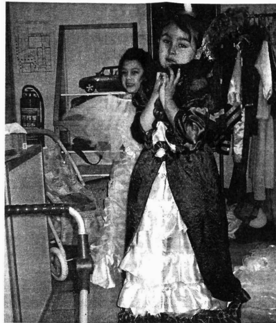
„Ich bin die Stiefmutter von Schneewittchen.“